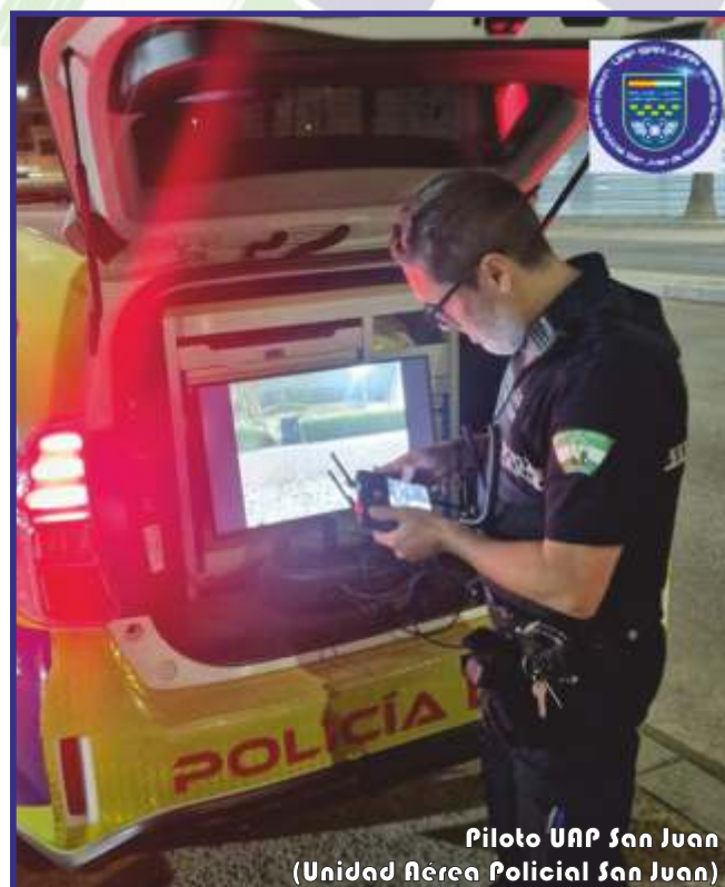
Piloto UAP San Juan (Unidad Aérea Policial San Juan)

Se modifican las distancias de los entornos aeroportuarios donde se necesita coordinación con el aeródromo, siendo reducidas en la mayoría de los casos.